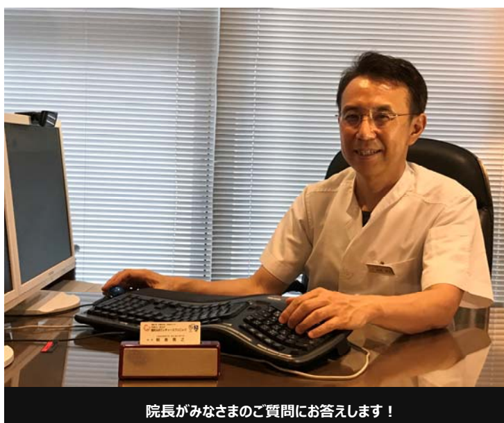
院長がみなさまのご質問にお答えします！